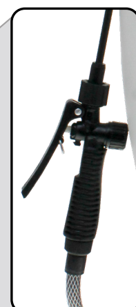
Asperjado automático al oprimir