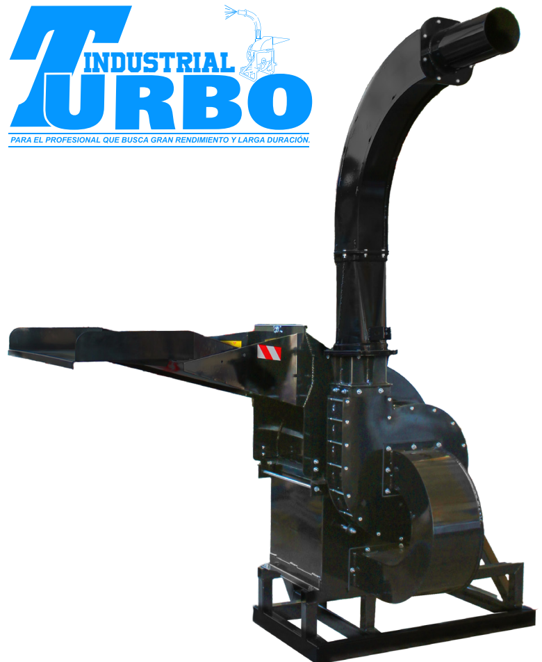
Pacas turbo industrial