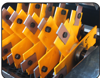
Martillos fijos de grueso calibre (1/4-6.4mm) de acero especial resistente al impacto y a la corrosión