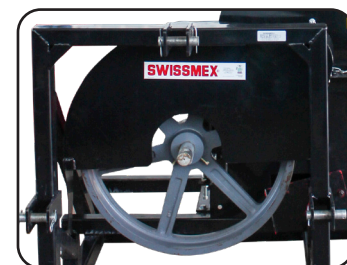
Resistente polea con protección para seguridad del operador

Para atención y asesoría de Servicio Post-Venta comuníquese con nosotros a: serviciopostventa@swissmex.com.mx Tel: 474 74 1 22 03