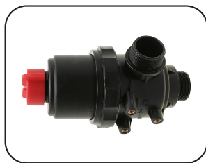
Filtro de admisión con check integrado