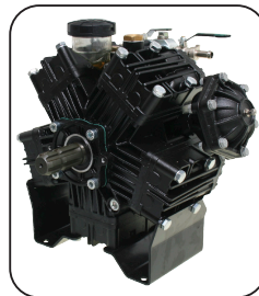
Bomba Delta 125