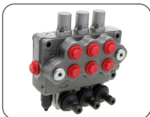
Mando hidráulico manual; con 3 palancas para movimiento vertical y apertura y cierre de aguilones, en forma independiente