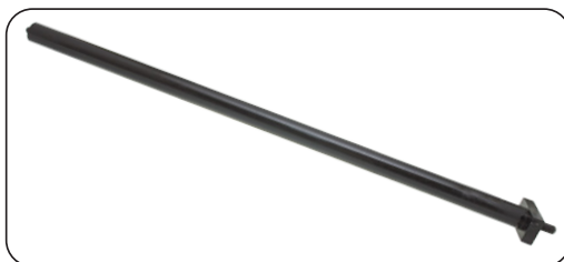
Pistón para el movimiento vertical del aguilón, con carrera máxima de 1.2 m.