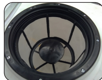
Mezclador hidráulico para polvos, ideal para disolver polvos humectables directamente en el tanque, ahorre tiempo ya que no necesitará realizar su mezcla en un contenedor aparte.