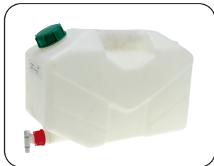
Tanque de 15 l para limpieza del operador.