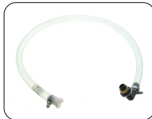
Línea de aforo del tanque, visible desde el puesto de mando del tractor.