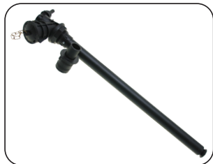
Hidrollenador, permite el llenado del tanque en menos tiempo.