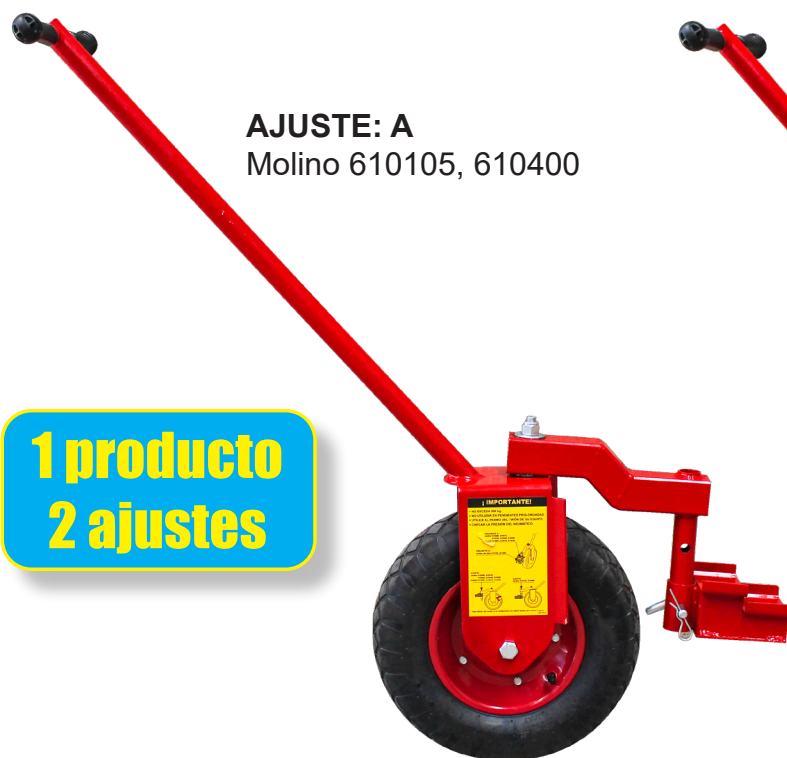
AJUSTE: A Molino 610105, 610400