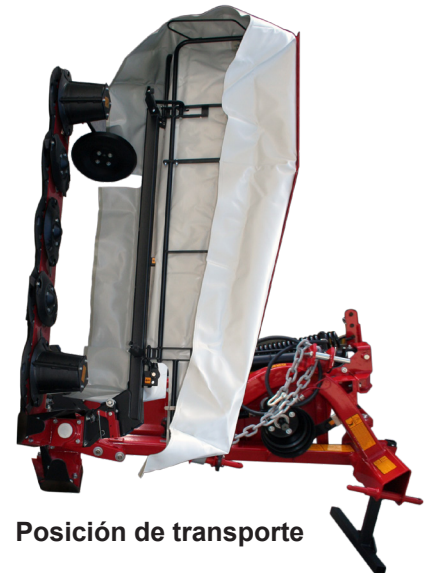
Posición de transporte

Para atención y asesoría de Servicio Post-Venta comuníquese con nosotros a: serviciopostventa@swissmex.com.mx Tel: 01 (474) 74 1 22 03