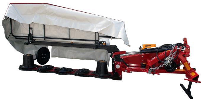
623101 (5 Discos)