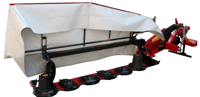
623102 (6 Discos)