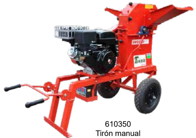
610350 Tirón manual

Palanca para aflojar las bandas que facilita el arranque del motor y tensarlas para su funcionamiento.