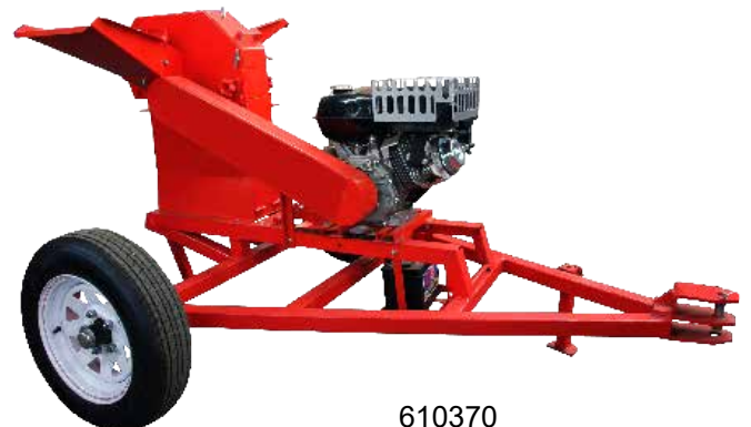
610370 Tirón motorizado (Cuatrimoto, motocultor, vehiculo, etc.) máx. 30 km/hr