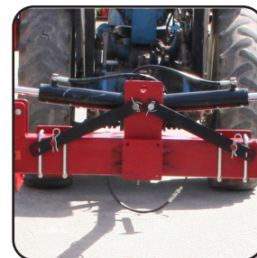
Seguro mecánico para posición de transporte.