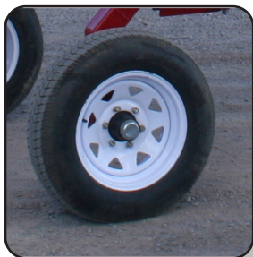
Neumáticos T205 / 75D15