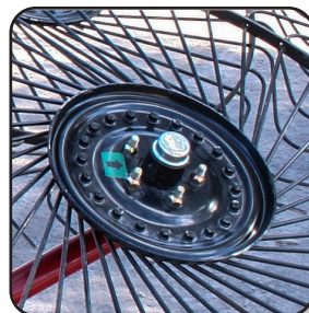
Masas tipo automotriz lubricadas de por vida.