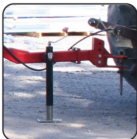
Pata soporte para descanso y facilidad de enganche.