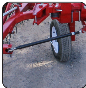
Barras roscadas para ancho de trabajo.