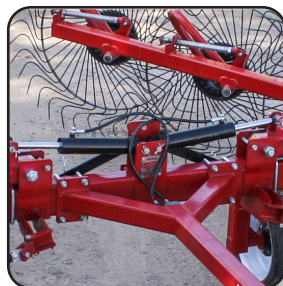
Cilindros hidráulicos para posición de trabajo y transporte.