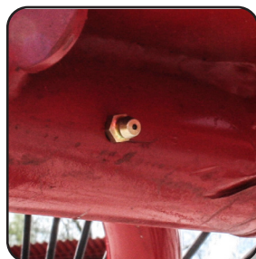
Graseras independientes por brazo.