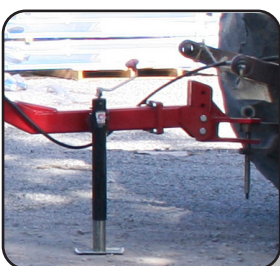
Pata soporte para descanso y facilidad de enganche.