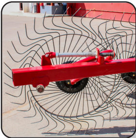
Brazos flexibles con resorte especial.

Con este rastrillo la presión del gancho en el material por recolectar es suave y constante, gracias a los amortiguadores tipo bumper y a los resortes especiales provistos en cada aro evitando daños al rebrote.