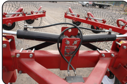
Cilindros hidráulicos para posición de trabajo y transporte.