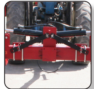
Seguro mecánico para posición de transporte.