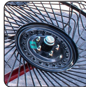
Masas tipo automotriz lubricadas de por vida.