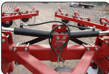
Cilindros hidráulicos para posición de trabajo y transporte.