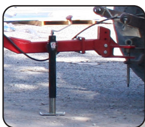
Pata soporte para descanso y facilidad de enganche.