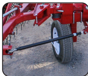
Barras roscadas para ancho de trabajo.