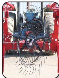
Se vende por separado y es un kit, acelera el secado del forraje