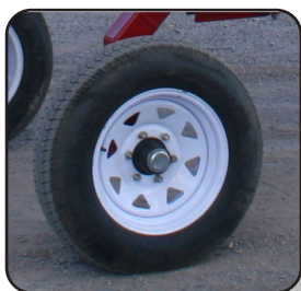
Neumáticos T205 / 75D15