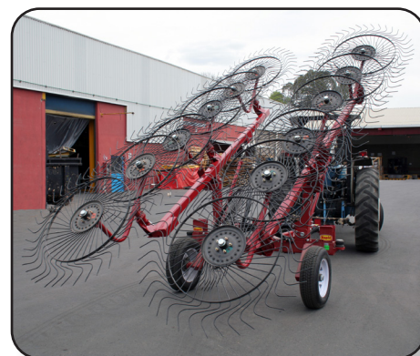
Subir y bajar los brazos es una tarea sencilla gracias a su sistema hidráulico el cual es totalmente controlable desde la cabina del tractor. Foto: Posición de transporte.