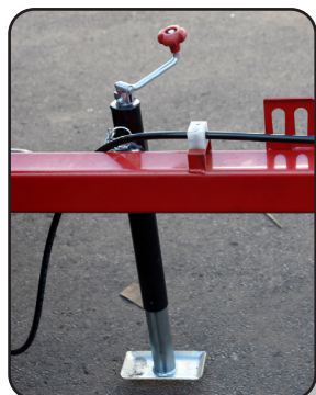
Pata para soporte, de activación mecánica

Con este implemento podrá cosechar el forraje de manera eficiente realizando hileras uniformes de alfalfa, pasto forrajero, frijol, pata de maíz, etc.