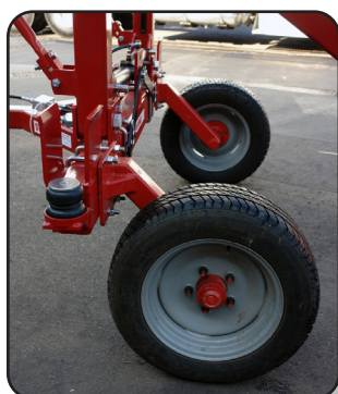
Llantas 205/75R16 (no revitalizadas) móviles que se acoplan a la distancia del surco.