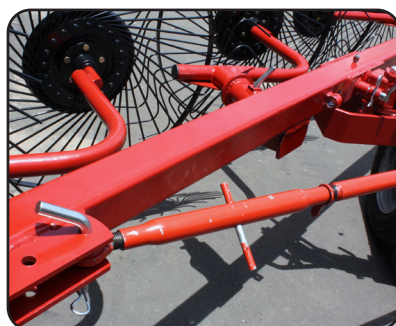
Palanca de ajuste de ángulo de ataque de fácil manejo

Para atención y asesoría de Servicio Post-Venta comuníquese con nosotros a: serviciopostventa@swissmex.com.mx Tel: 01 (474) 74 1 22 03