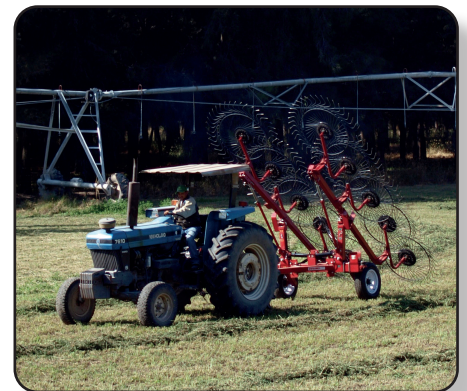
Subir y bajar los brazos es una tarea sencilla gracias a su sistema hidráulico el cual es totalmente controlable desde la cabina del tractor. Foto: Posición de transporte.