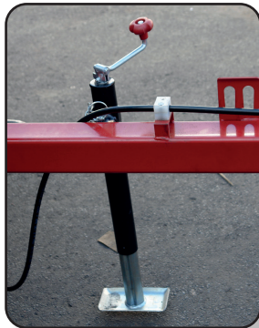
Pata para soporte, de activación mecánica

Con este implemento podrá cosechar el forraje de manera eficiente realizando hileras uniformes de alfalfa, pasto forrajero, frijol, pata de maíz, etc.