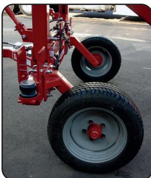
Llantas 205/75R16 (no revitalizadas) móviles que se acoplan a la distancia del surco.