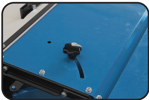
Regulador de cortina de salida del material