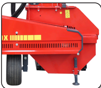
Volante de picado con 10 cuchillas y 5 palas lanzadoras