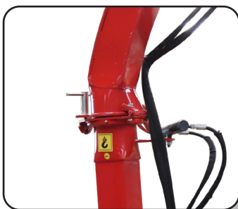
Tubo de descarga con movimiento hidráulico