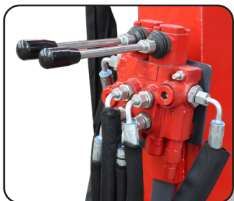
Control hidráulico para tubo de descarga y deflector