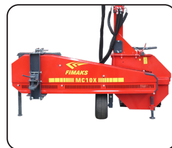
Tracción por Bandas