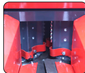
2 tambores alimentadores y 2 rodillos de presión que controlan la alimentación