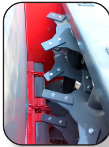
2 ROTORES VERTICALES CON 10 CUCHILLAS REMPLAZABLES