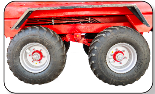
DOBLE EJE CARDAN