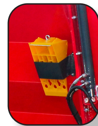
CUÑA DE TRASLADO

Para atención y asesoría de Servicio Post-Venta comuníquese con nosotros a: serviciopostventa@swissmex.com.mx Tel: 474 74 1 22 03