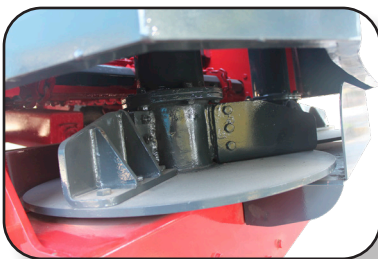
PLATO ESPARCIDOR LATERAL PARA APLICACIONES DIRIGIDAS