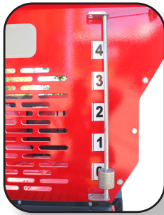
ESCALA PARA COMPUERTA DE DOSIFICACIÓN