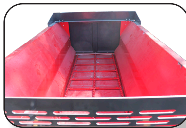
BANDA TRANSPORTADORA POR CADENA Y SISTEMA HIDRÁULICO