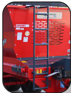
ESCALERA Y BALCÓN PARA INSPECCIÓN