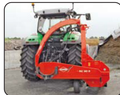
Canal plegable para almacenamiento y transporte. (MC 90 S y MC 90 S TWIN)