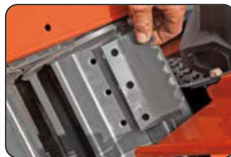
Juego opcional de peines de admisión para maíz resbaladizo o alto. (de serie en MC 180 S QUATTRO)