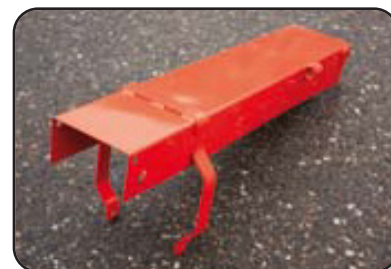
Extensión de canal de 80 cm opcional. (MC 90 S y MC 90 S TWIN)

Ideal para lograr un silo de buena calidad conservando los nutrientes que el ganado necesita.