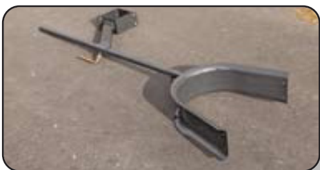
Guía de cultivos ajustable para cultivos altos (opcional sólo en MC 90 S)