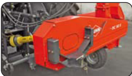
Gancho de remolque en posición baja. (MC 90 S y MC 90 S TWIN)