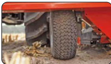
Rueda de apoyo. (MC 90 S y MC 90 S TWIN)