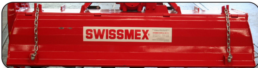
Tapa con cadena