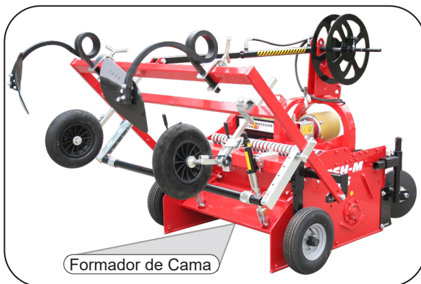
Modo de transporte