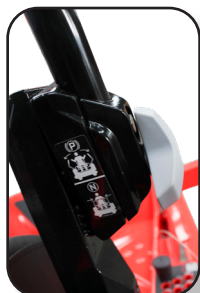
Nueva activación de freno de mano