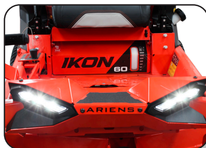
Potentes faros led