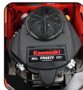
Motor Kawasaki® FR691V