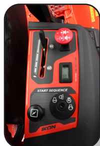
Mando de control