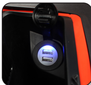
2 conexiones USB 5 voltios