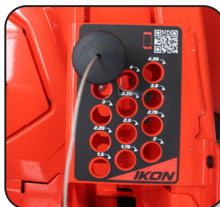
Panel para control y ajuste de altura de corte