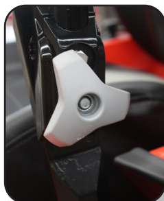
Práctico ajuste de manubrios