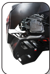
Protección de escape