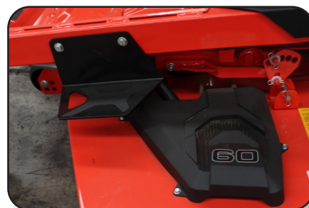
Estribo de acero antiderrapante